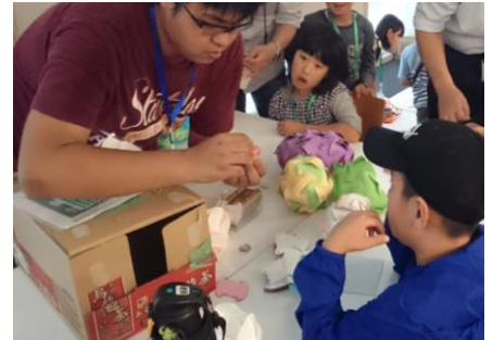
ホルガー・ストロムのIQライトをつくってみよう！