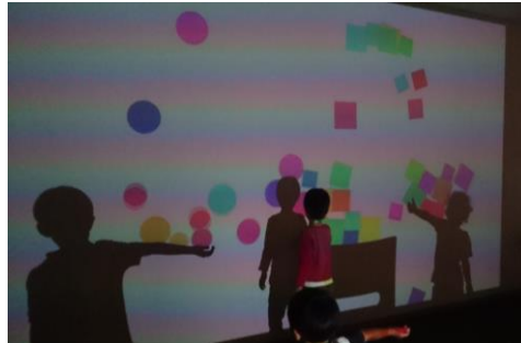
影のボールプール